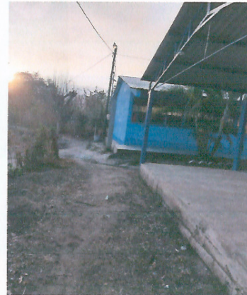
Foto 4: OTRO ANGULO DEL ÁREA DONDE SE CONTEMPLA HACER EL MEJORAMIENTO DE CERRAMIENTO DE MURO PERIMETRAL.

Observación: Si es necesario se pueden agregar hojas adicionales y actualizar el número de hojas.