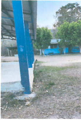
Foto 1: ÁREA DONDE SE CONTEMPLA HACER EL MEJORAMIENTO DE CERRAMIENTO DE MURO PERIMETRAL.