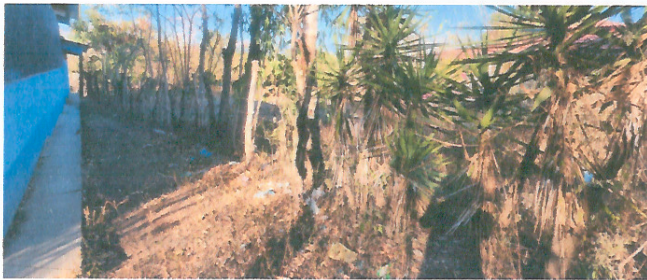
Foto 3: OTRO ANGULO PARA REALIZAR EL MEJORAMIENTO DE CERRAMIENTO DE MURO PERIMETRAL.